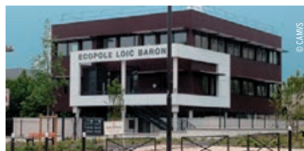
L'écopôle Loïc Baron à Melun

de la Plaine du Lys. Sur place, les futurs entrepreneurs disposeront de quinze postes de travail (dix bureaux individuels et un espace de co-working pouvant accueillir cinq personnes) et d'une salle de réunion.