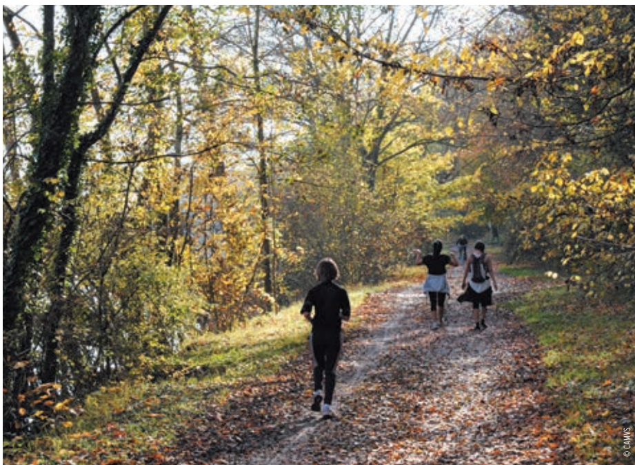
La valorisation des berges de Seine est une des préoccupations exprimées par les habitants

À l'occasion de la phase d'état des lieux, 279 internautes ont pu déposer près de 440 idées, qui ont suscité plus de 200 commentaires et 2100 votes. Le bilan de ces contributions, consultable sur le site internet de l'Agglomération, a ainsi fait ressortir 7 sujets transversaux que le Projet d'Aménagement et de Développement Durables (PADD) a pu prendre en compte.