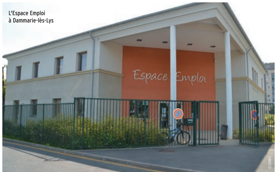
L'Espace Emploi à Dammarie-lès-Lys

Le premier sera implanté au sein de l'Ecopôle Loïc Baron, dans le quartier Montaigu à Melun. D'une surface de 130 m 2 , il disposera de sept bureaux individuels et d'une salle de réunion. Le second site sera installé à Dammarie-lès-Lys, plus précisément dans le bâtiment de l'Espace Emploi situé dans le quartier