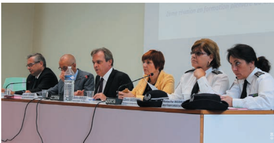
Les partenaires du CISPD ont présenté officiellement leur stratégie, le 22 septembre.