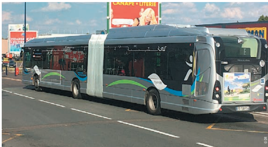
Les véhicules articulés circulent sur les lignes de bus les plus fréquentées du réseau.

Vous les avez sans doute aperçus et peut-être même déjà empruntés... Quoi ? Les nouveaux bus hybrides articulés du réseau Melibus ! Depuis novembre, trois véhicules de ce type circulent sur les lignes E et D/L. Leurs principaux atouts : confort et respect de l'environnement.