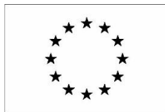
Version noir et blanc